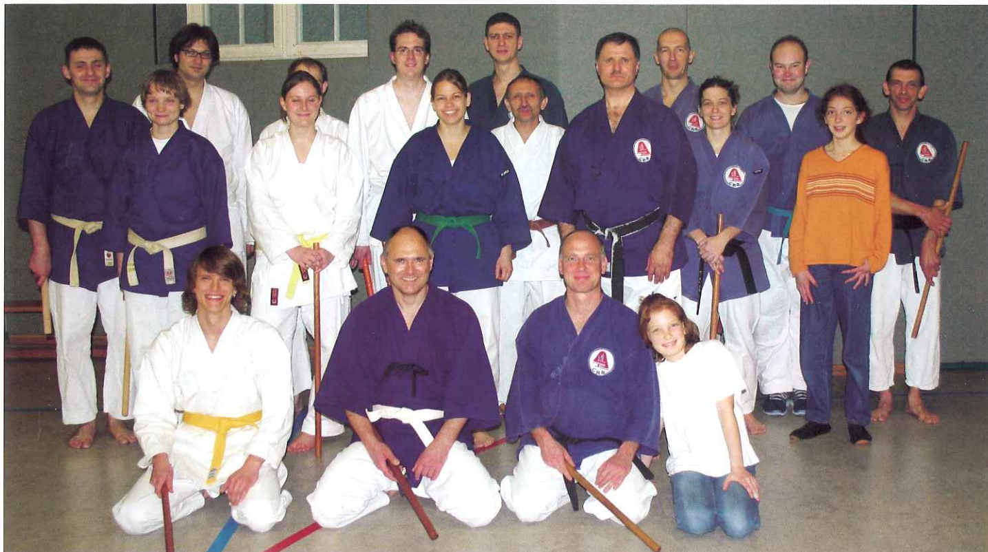
Die Teilnehmer des Kobudo-Lehrganges