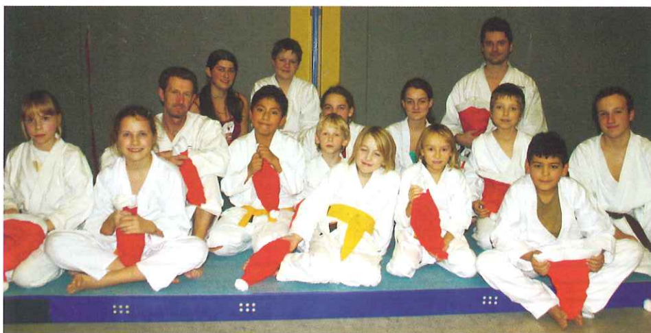
Die Kinder nach der Bescherung

Die Tatsache, dass alle Kinder der Kinderkurses geschlossen anwesend waren, war ein Beweis für die gute Jugendarbeit, die von unserem Trainerteam im vergangenen Jahr geleistet wurde. An dieser Stelle ein Dankeschön an die Trainer für den engagierten Einsatz!