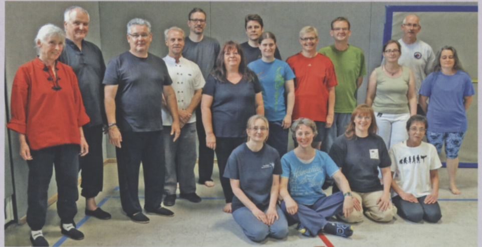
Die Teilnehmer der Tai Chi Ausbildung in Ingolstadt

Hilfreich für ein tieferes Verständnis war außerdem, dass alle Figuren der Form auch