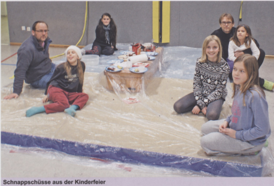
Schnapschüsse aus der Kinderfeier